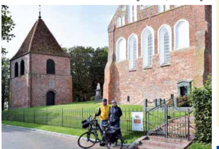
Ev.-ref. Kirche Grimersum

Samstag, 07. September 12. Krummhörner Kirchturm- und Rundfahrt mit dem Fahrrad zu den Kirchtürmen der Krummhörner Kirchen Gemeinden Information zur Krummhörner Kirchturm- und Rundfahrt - www.greetsiel.de/veranstaltungen